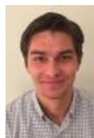
Hemming Hanses Ledamot