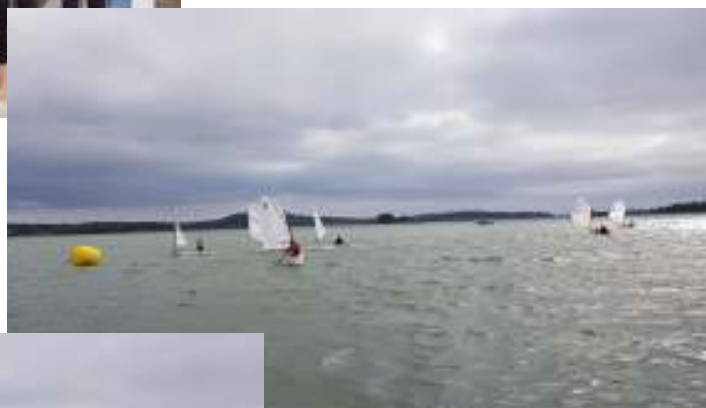
Optimistjolle-ÅM 2019.