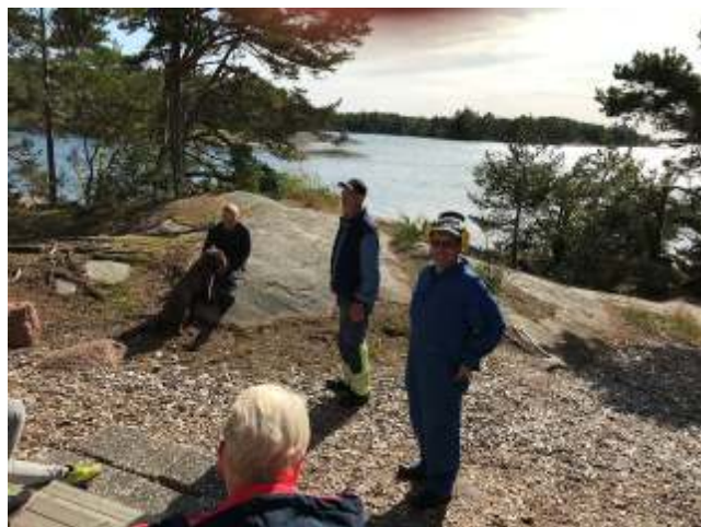
Talkoarbetare på paus i solskenet.