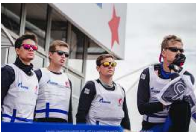
MSF Sailing Team.

Laget var ändå nöjda med prestationerna mot slutet och man tog lärdomar med sig inför framtida tävlingar.