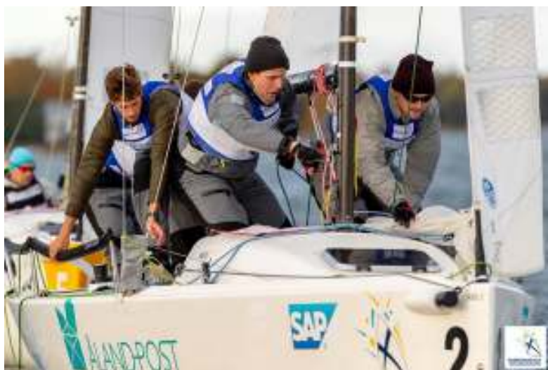
Seglingsligan 2019.