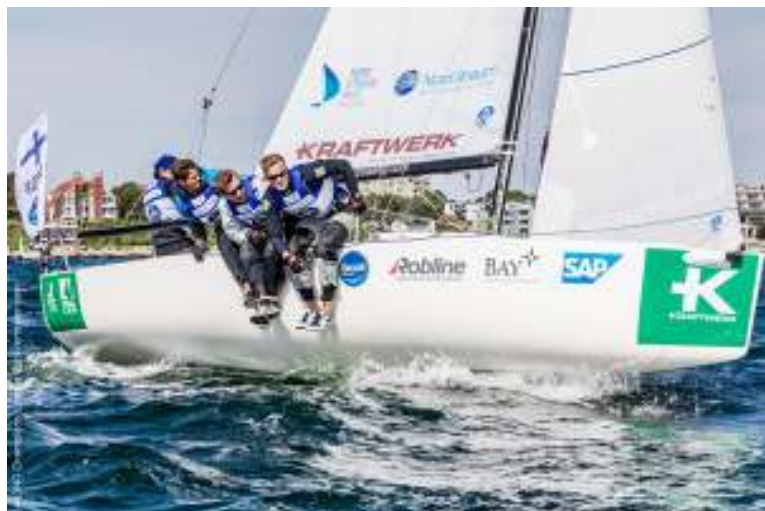
MSFs team kämpade tappert i Kiel. Foto:

Lite bittra efter det racet var laget ändå nöjda med prestationerna och satsar på att komma tillbaka nästa år.