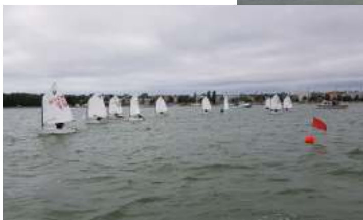
Optimistjolle-ÅM 2019.