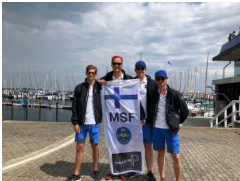
Glada och peppade killar! Foto: