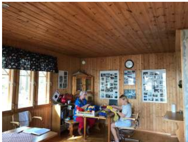
Flinka händer binder midsommarkronor.