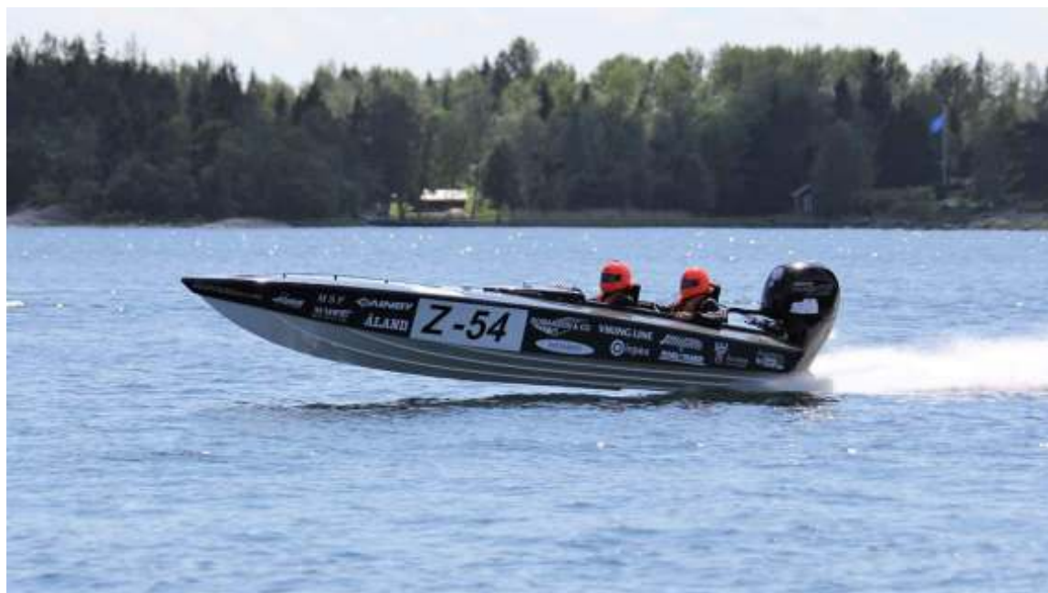
Team Rookie Racing susar fram över vattnet

Team Rookie Racing körde 2019 sin fjärde säsong inom offshore racing. Vi kände efter förra säsongen att Scaraben hade god potential i UL-klassen och vi bestämde oss för att bygga om vissa grejer samt reparera skadorna efter fjolårets krasch. Trimtank i fören byggdes, stolar, instrumentpanel, trimpumpar och batteriet flyttades fram samt att skadorna reparerades ordentligt och båten lackades om.