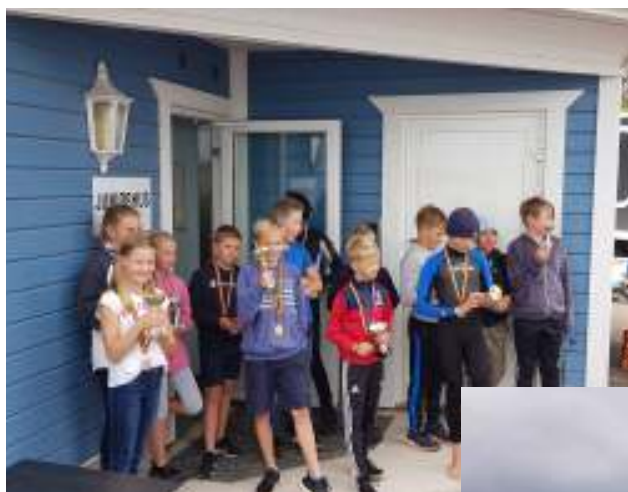
Nöjda juniorer vid prisutdelning efter lättbåts-ÅM.