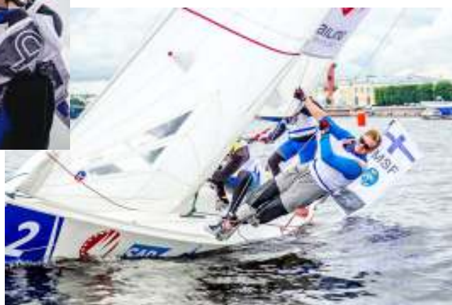
Full fart framåt. Foto: