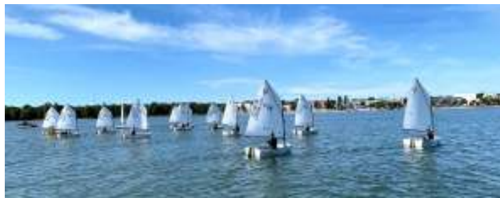
Optimistjolle-ÅM 2019 arrangerades av MSF.

Optimistjollesäsongen inleddes med jollekantring i Ålands Sjösäkerhetscentrum den 13 april. I mitten av maj startade torsdagsträningarna på Slemmern och mellan slutet av juni och mitten av augusti hölls träningarna på Seglarnästet vilket alltid är populärt bland barnen.