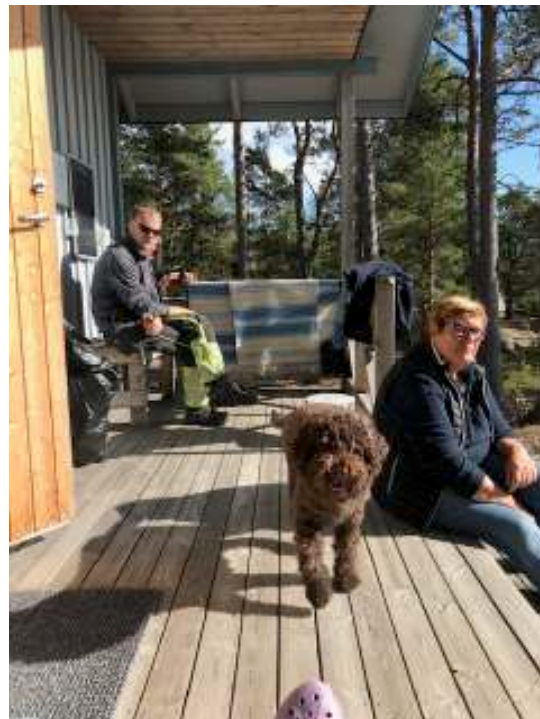
Talkosamvaro. En klar förmån för villiga händer.

Vi har kunnat konstatera att det har varit mycket folk på vår fina ö i år igen, ända nackdelen i år så har varit att några medlemmar har tagit sig lite väl stor frihet utan att kontakta intendenten eller styrelsen för att bekräfta sina planer med utsättande av en boj. som det är beslut från styrelsen att det inte ska finnas en sådan där och detta fick jag reda på när jag och frun var på semester i Sverige, så att det blev några dagar som blev förstörda. Jag vart så arg att jag övervägde att sluta som intendent, men det var några medlemmar som kontaktade mig och stödde mig, så jag kände att jag hade stöd från föreningens medlemmar. Det fortsatte också efter att jag varit och tagit bort bojen. Två gånger till märktes den ut, efter det så ordnades det så att allt togs bort.