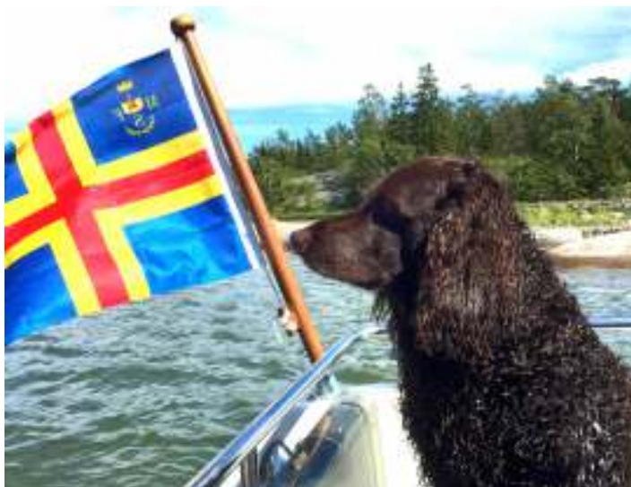
Mot nya äventyr!