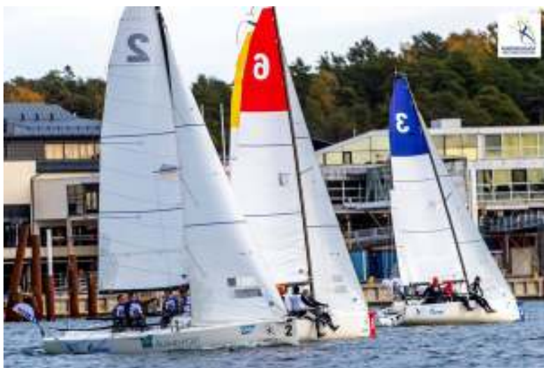
Full koncentration.

För MSF gick det inte lika bra som slutade på en nionde placering. Detta innebär även att MSF inte kommer få segla Sailing Champions League 2020 eftersom de fem bästa lagen fick de platserna.