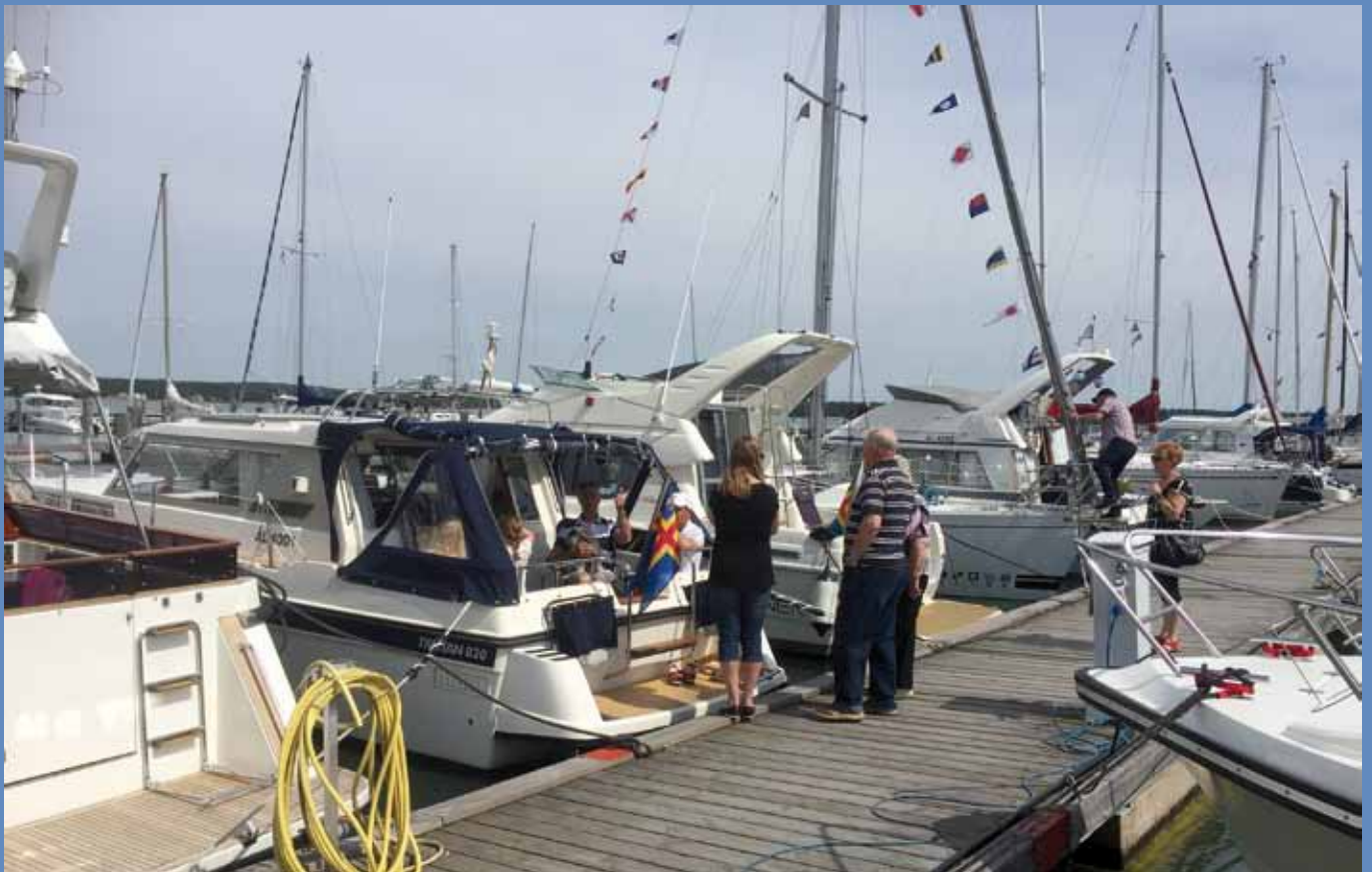
100-års firande.