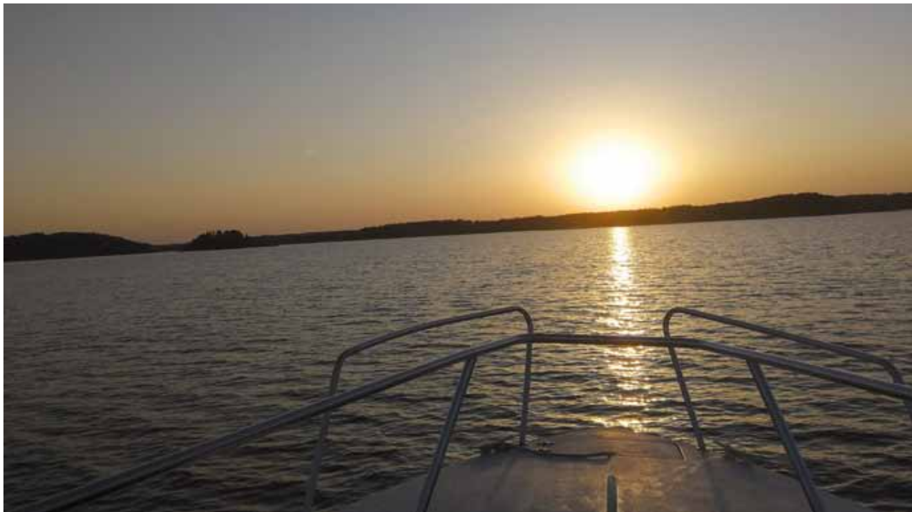
Kommodorens Xanthé på hemfärd i lugna vatten.

Föreningens jubileumsår har nått sitt slut. 100 år av sprudlande verksamhet har passerat och vi kan konstatera att det är en pigg 100-åring som ingalunda har slut på krafter än.