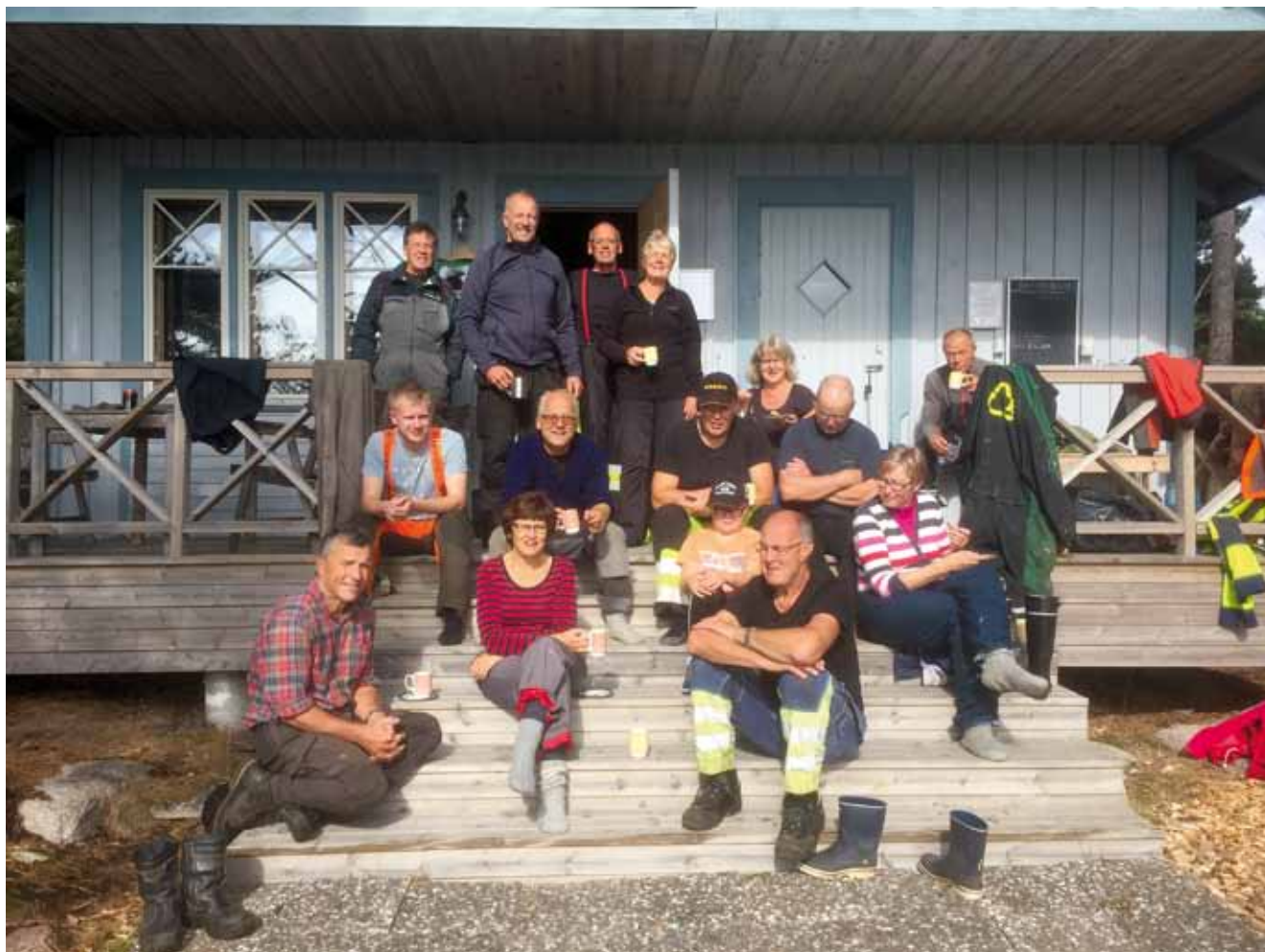
Hösttalka på Möholm.

Så har man då att sammanfatta detta år med några ord. Till att börja med så vill jag tacka alla medlemmar som har ställt upp på både det ena och andra.