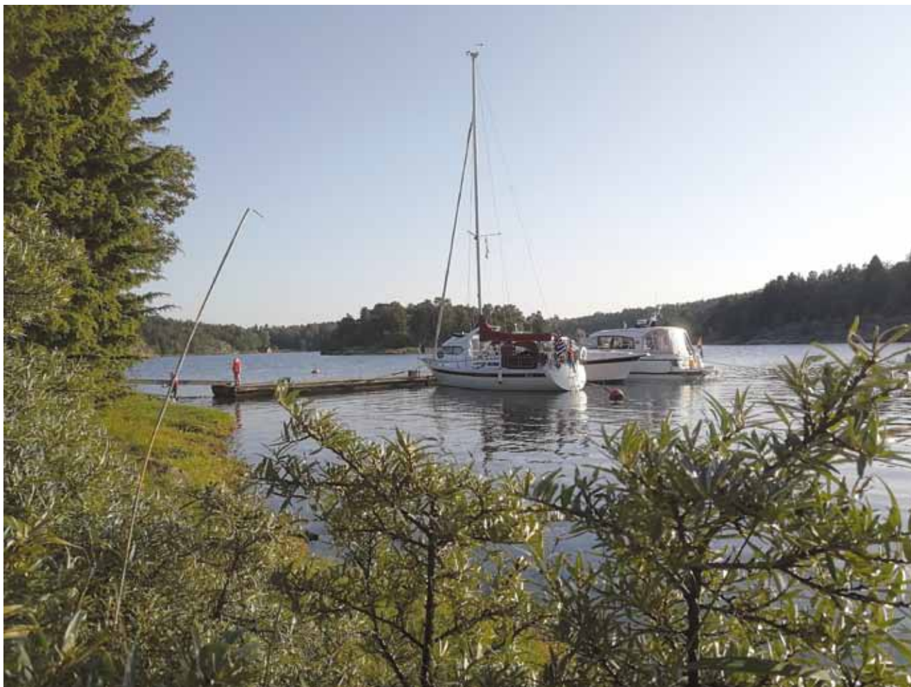
Höst på Seglarnästet.

2017, jubileumsåret, har passerat och likaså ännu en båtsäsong att minnas under de kalla och mörka vinterdagarna. Säsongen på Nästet inleddes tidigt då ivriga medlemmar sjösatte och begav sig ut för att sätta igång anläggningen med koppling av vattentunnor och för att skaka ut dammet från stuga och bastu. Det är de här insatserna som är så glädjande. Villiga händer som för eget och andras välbefinnande ställer upp och fixar, plockar och donar. Det är en fantastisk anläggning som nyttjas flitigt tack vare dess närhet till staden. Många är de båtar som under vår, sommar och höst tar en kvällsutflykt med bastu, bad och fika i kvällssolen. Därmed behövs också alla små insatser som görs och från jollenämndens håll vill vi tacka alla som ställt upp och hjälpt till, ni är värda en extra guldstjärna.