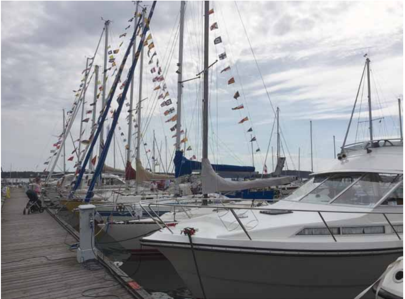
100 års firande.

När arbetet med 100-årsjubiléet inleddes 2010 kändes allt avlägset och tiden kändes enormt lång, det fanns ju gott om tid att sammanställa historik och planera firandet. Ack så fel, men ack så bra det blev till sist!