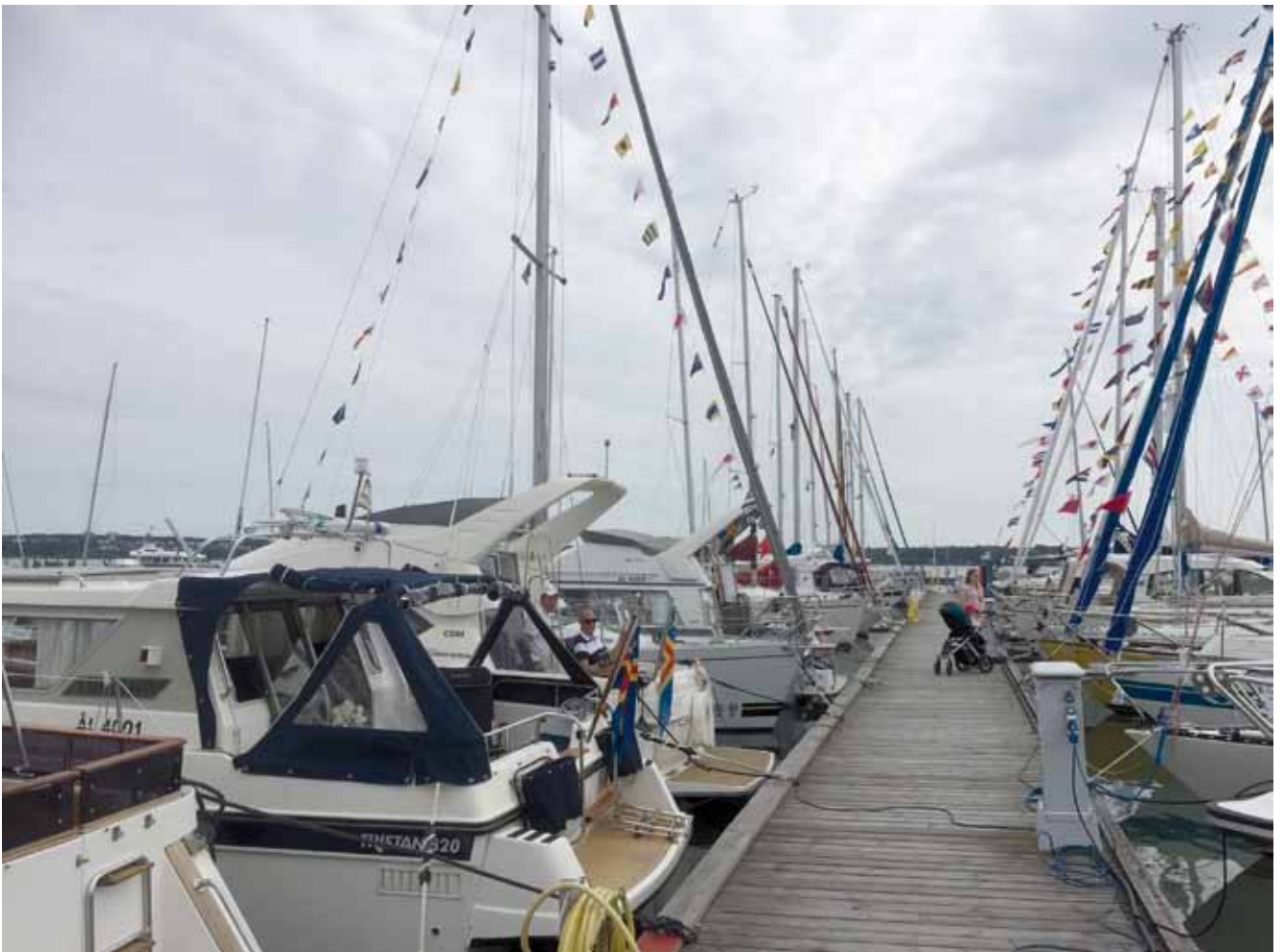
100 års firande.