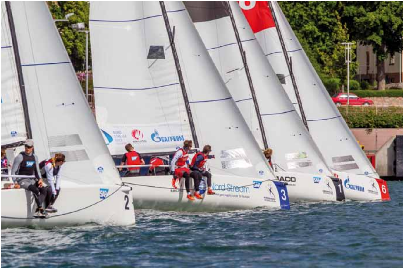
MSF i båt nummer 3 på tät kryss.