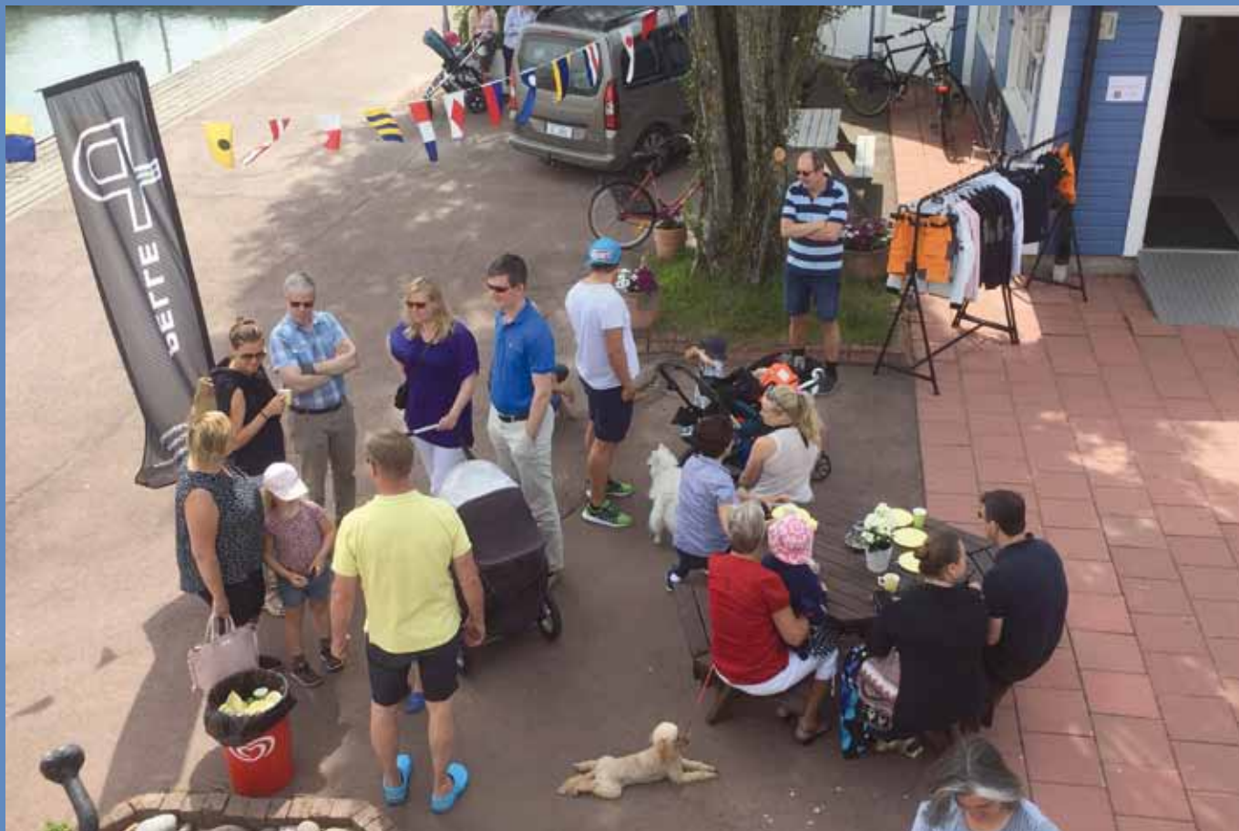
Hundraårskalas i hamnen.