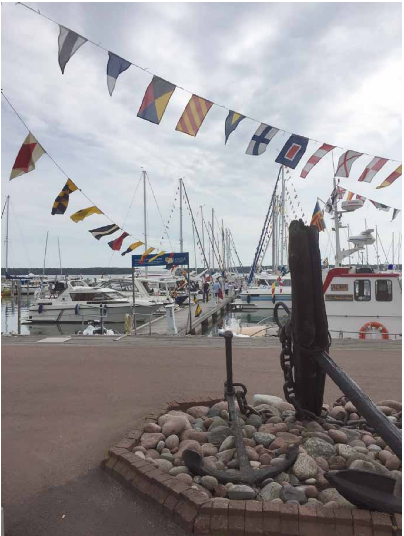
100 års firande i gästhamnen.