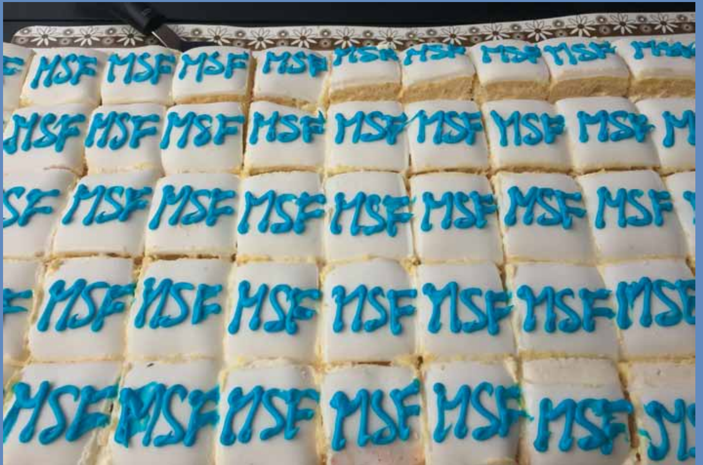
100-års tårtan.