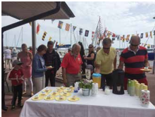
100-års tårta.