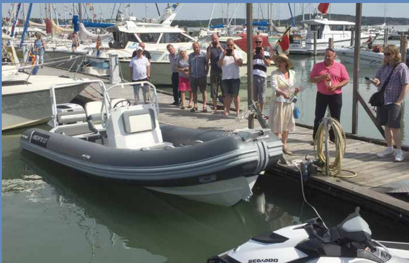
Dop av EU projekt under 100års kalaset.