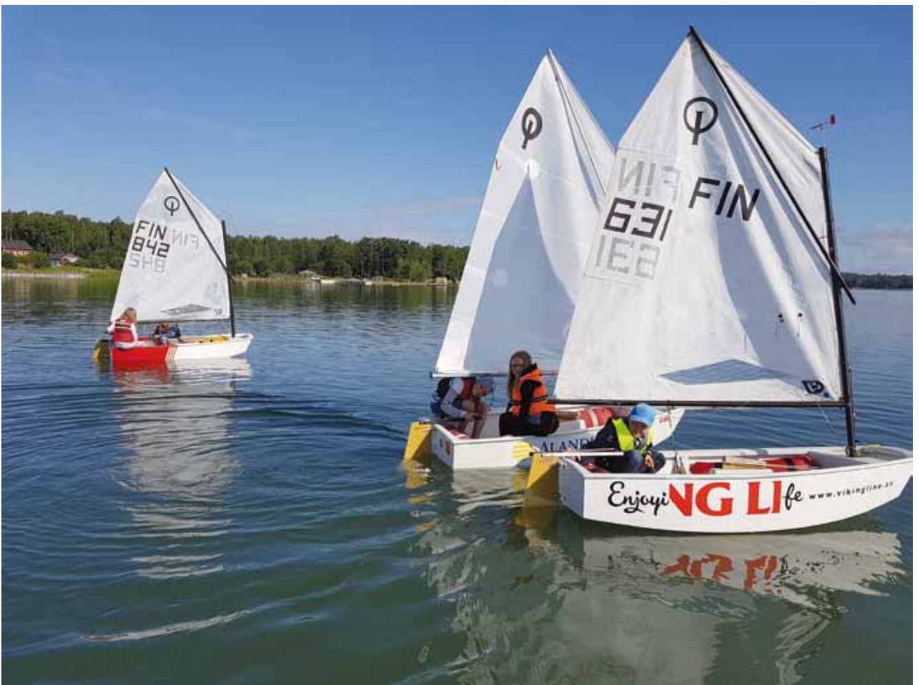
I väntan på vind på minilägrer.