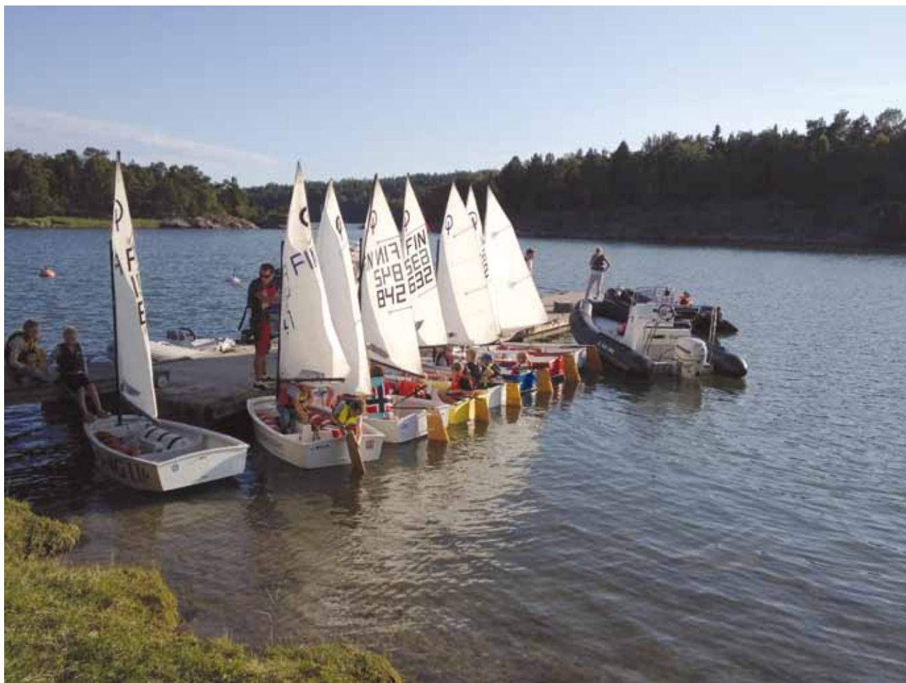
Kvällsträning på Seglarnästet.