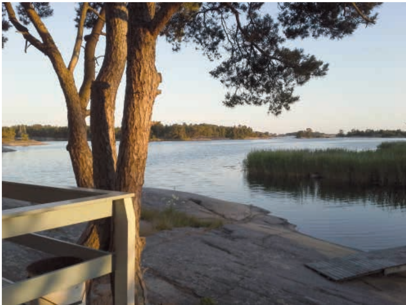
Bastu på Möholm är aldrig fel.

Så har man då att sammanfatta detta år med några ord, kan konstatera att man börjar bli lite varm i kläderna vad beträffar intendent jobbet. Till att börja med så vill jag tacka alla medlemmar som har ställt upp på både det ena och andra.