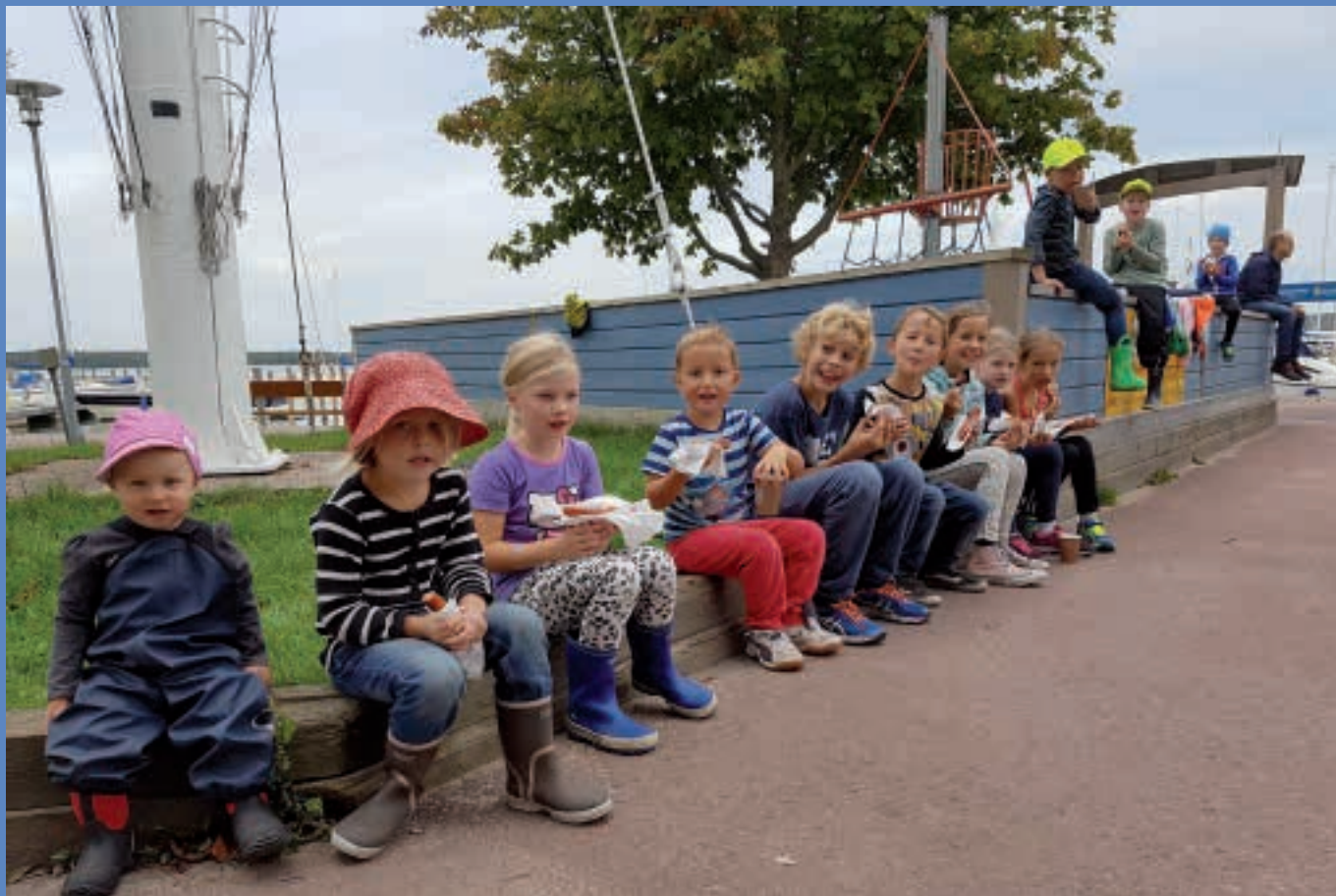
Jolletalka med korvgrillning.