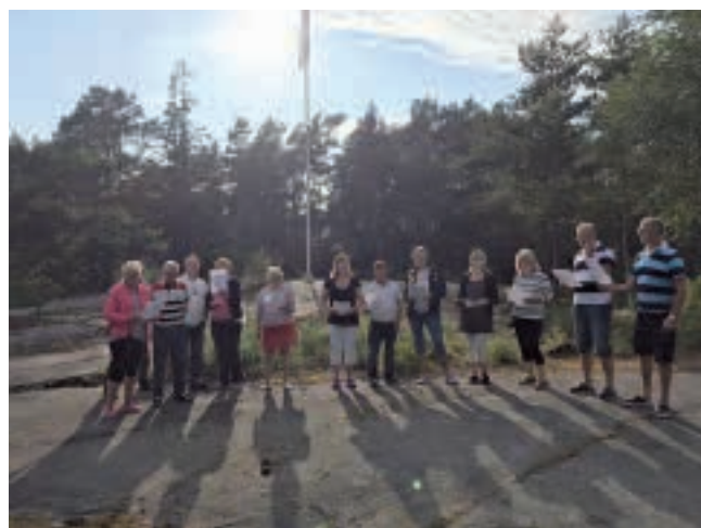
Några av föreningens sångfåglar på midsommar.