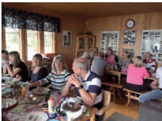
Midsommarmiddag på Möholm.