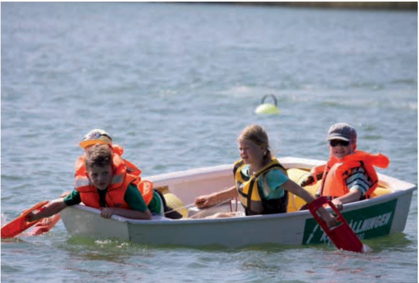
Lek på småttinglägret.