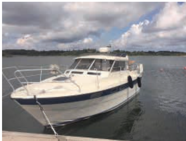
Kommodorens Ziwa på visit i Sandvik.

Mitt eget intresse för segling har lett till att en segelbåt