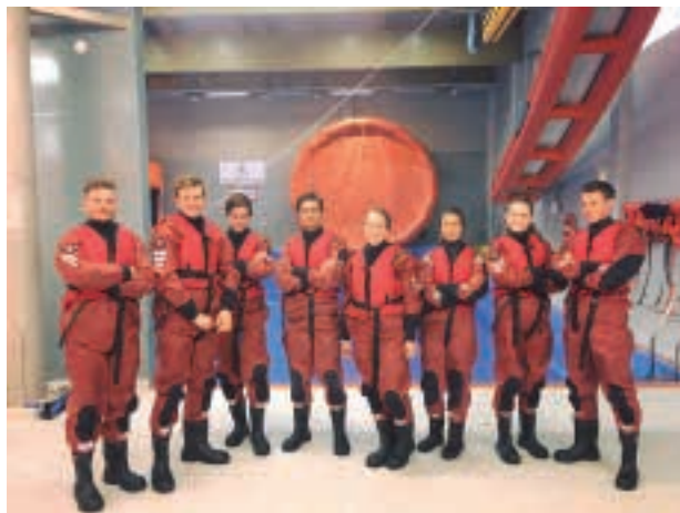
Gästhamnspersonal på utbildning.

Under våren färdigställdes de nya bryggorna på hamnens norra sida, något som har gett en verklig kvalitetshöjning i hamnen. Under de blåsigare dagarna har man sett en stor skillnad inne i bassängen där det nu är lugnare. Därtill är nu den yttre ramen bättre anpassad för dagens båtar. Vi utökade även antalet bokningsbara platser, på gott och på ont. Det krävs en hel del arbete med de bokningsbara platserna, men vi ser samtidigt att många av våra gäster väljer att nyttja möjligheten och uppskattar att man kan vara säker på att få plats i hamnen under de mer intensiva veckorna.