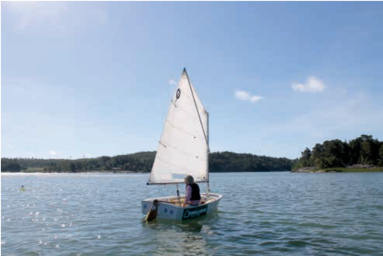
Semsterseglats, eller var det juniorseglats.