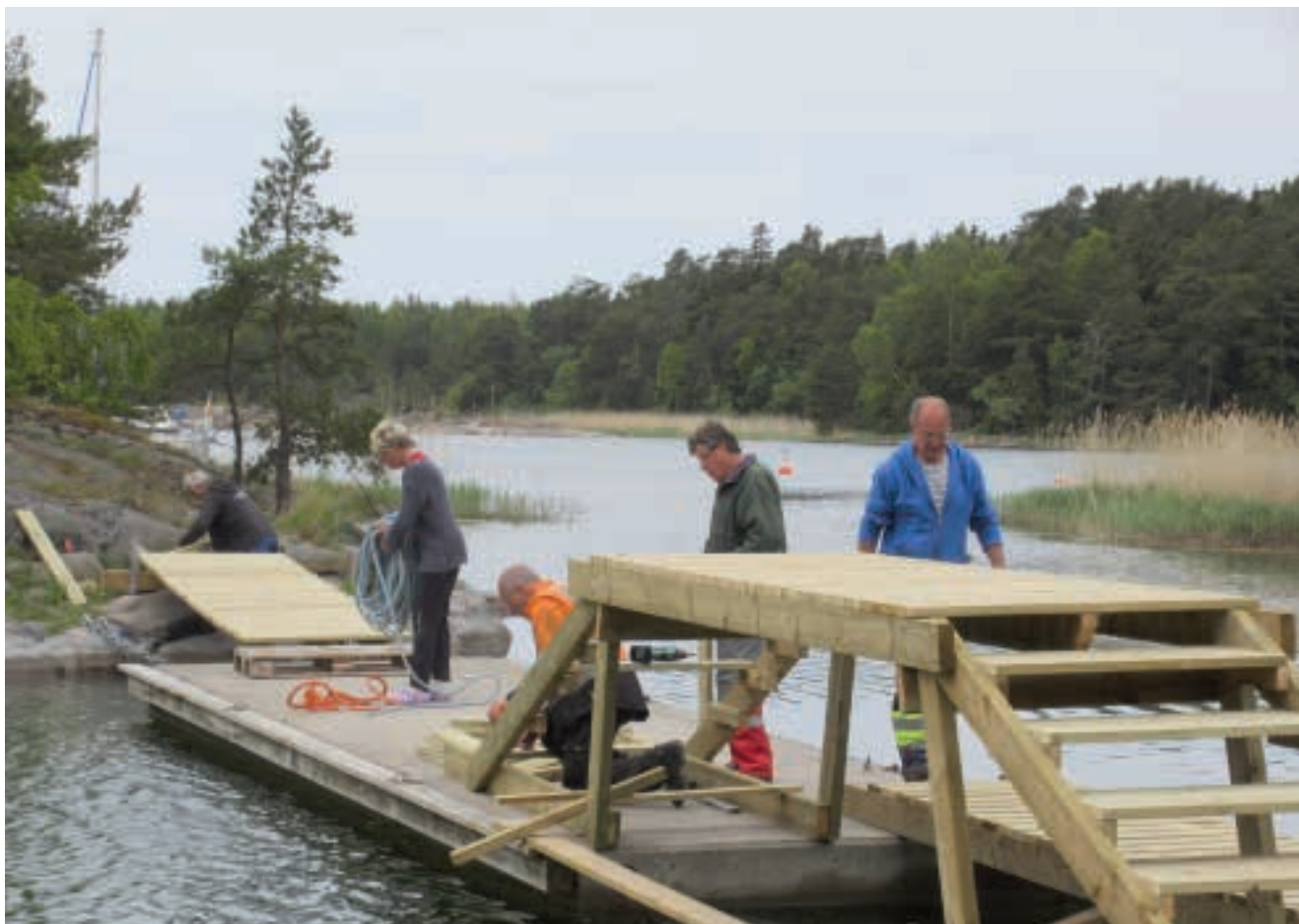
Bygge av Eddie Gate.